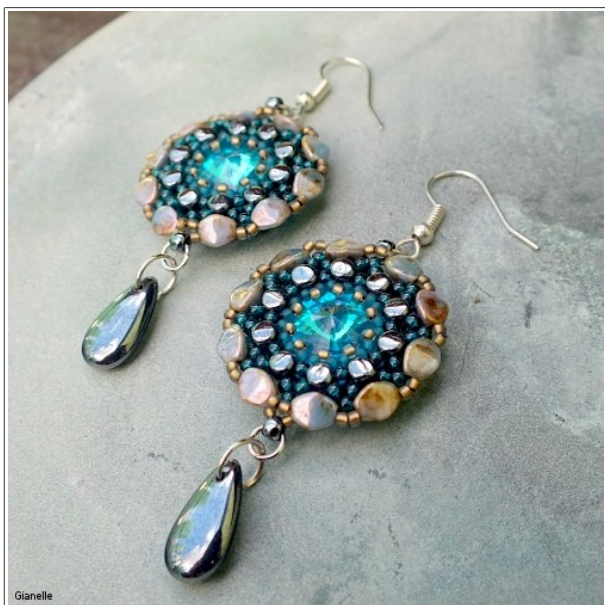
Modré náušnice s kapkami.

Řady 24, 25 a 26 došijte jako obvykle a poté zapošijte a zavěste.