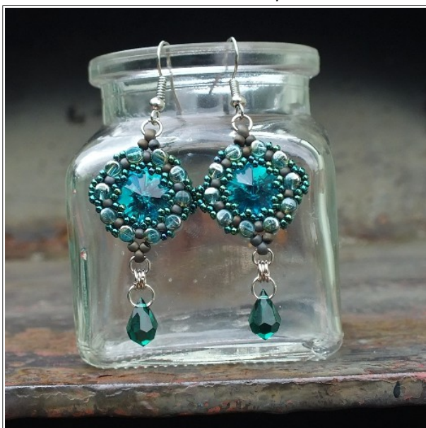
Jiný způsob zdobení.

Zde jsem nahradila rokajl 15/0 v krocích 7-12 a 18 a rokajl 11/0s v krocích 21 - 27 korálky Miyuki Delica 11/0.